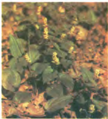
667. Веснівка дволиста.